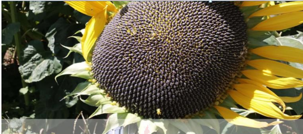
Abb. links: Bessere Befruchtung – ausgeprägter tellerförmiger Korb, das Zentrum ist voll beladen mit Kernen

Beim Anbau von Sonnenblumen tauchen immer wieder zwei Probleme auf – Pilzkrankheiten und die unbefruchtete Mitte der Blüte. Beide Faktoren machen den Ertrag geringer.