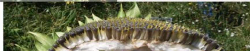
Abb. unten: Der Teil direkt unter der Sonnenblumenrose (parenchymatischer Teil) ist weiß und gesund.

Abb. links: Bessere Befruchtung – ausgeprägter tellerförmiger Korb, das Zentrum ist voll beladen mit Kernen